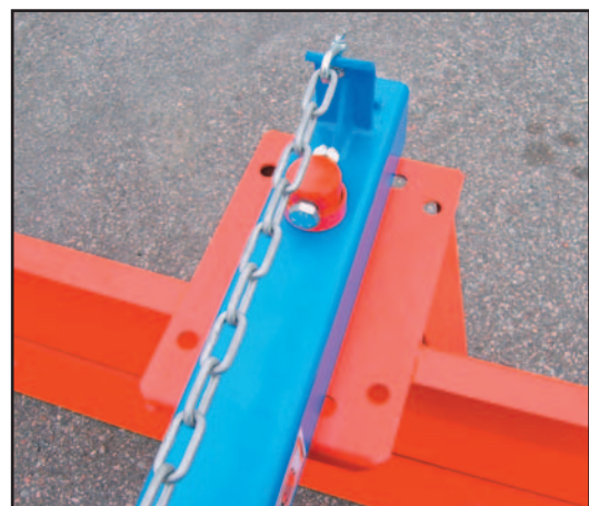
Hål i vändkransen tillåter justering av bladets vinkel