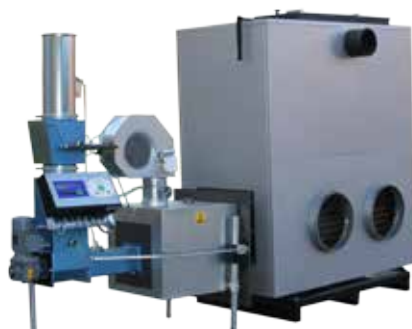
Stoker med Varmluftspanna