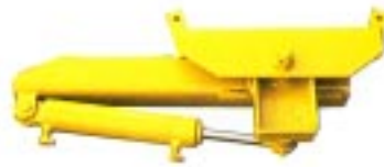
Hydraulinsvågning av bom.