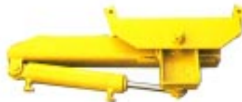
Hydraulinsvågning av bom.